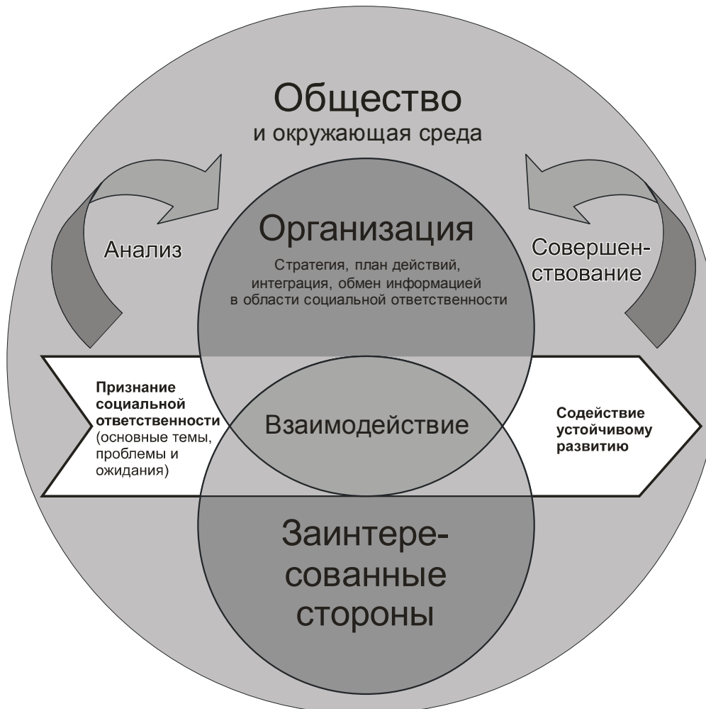
Рисунок 4 – Интеграция социальной ответственности повсеместно в организации